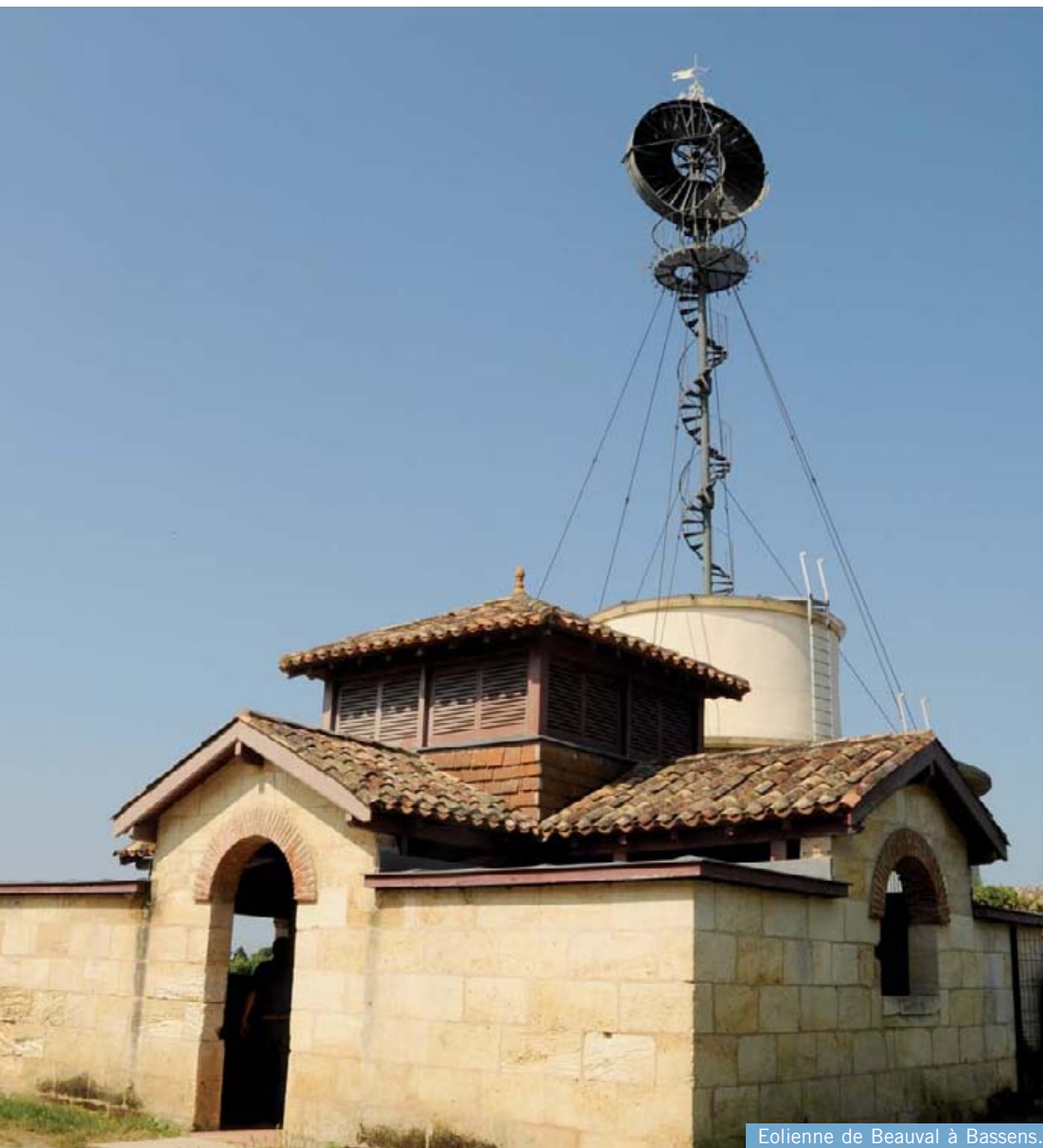
Eolienne de Beauval à Bassens.