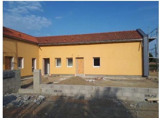
Après les travaux