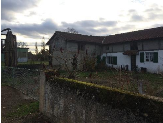
Avant les travaux